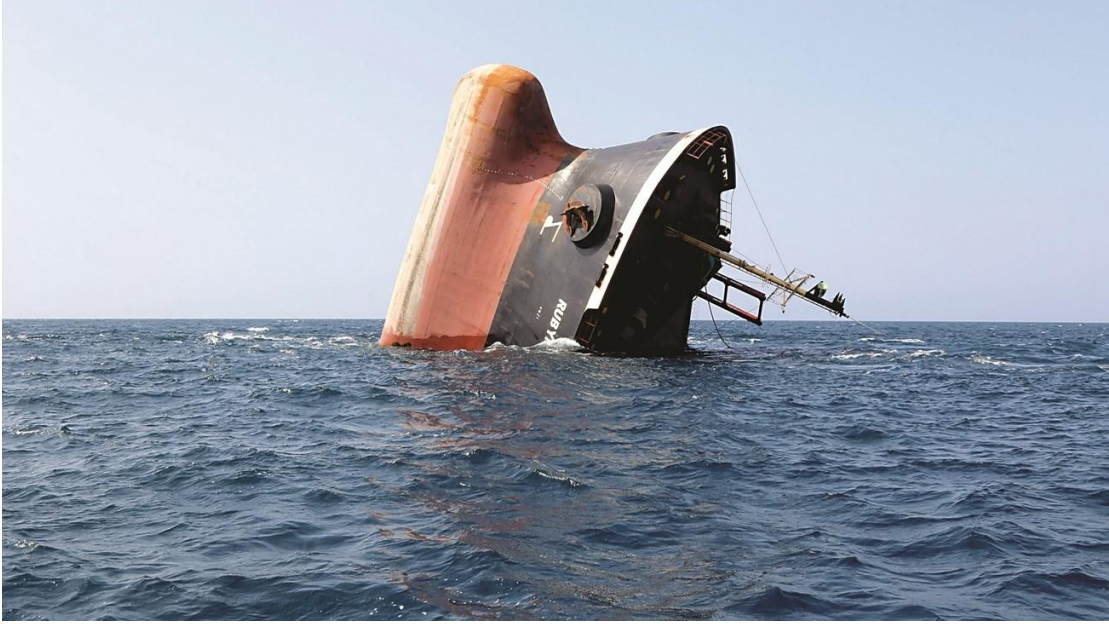
السفينة البريطانية "روبيمار" خلال غرقها قبالة ساحل مدينة المخا في البحر الأحمر، عقب استهدافها من قبل الحوثيين في 18 فبراير 2024