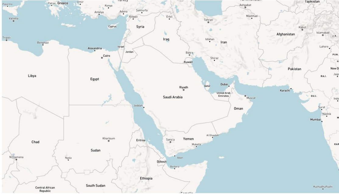
خريطة توضيحية لمنطقة البحر الأحمر وخليج عدن بواسطة mapbox