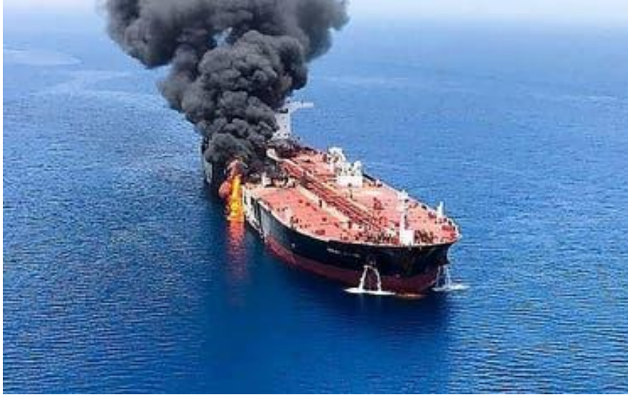
الصورة: نقلا عن صحيفة تايمز أوف إسرائيل للسفينة الإسرائيلية في بحر العرب

استهدفت جماعة الحوثي نحو 61 سفينة شحن تجارية وعسكرية في البحرين الأحمر والعربي من خلال 64 هجوماً بالصواريخ الباليستية والطائرات المسييرة وأسلحة أخرى، حتى 06 مارس 2024، وفق تأكيد زعيم الجماعة في كلمة متلفزة. 22