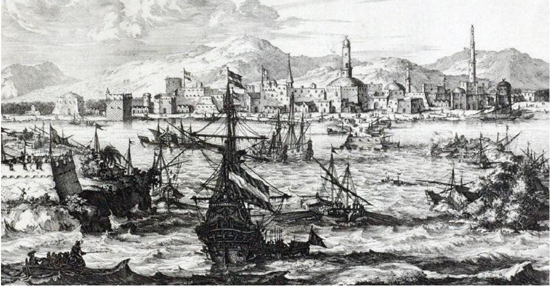
مراكز تجارية بريطانية وهولندية بمدينة المخا اليمنية - ويكيبيديا